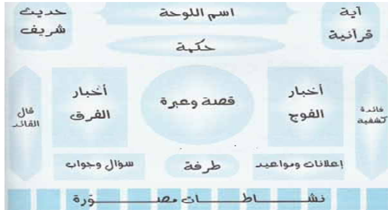
مخطط التصميم العام للوحة الحائط